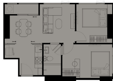
2 BEDROOMS 46 SQ.M.