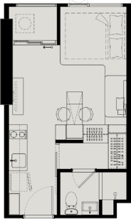
STUDIO 23 – 26 SQ.M.